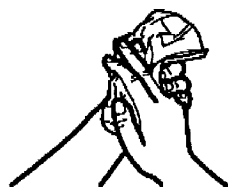
5. Hände mit Einweghandtuch gut trocknen