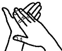
3. Hände reiben, inkl. Handrücken, Finger und Handgelenke