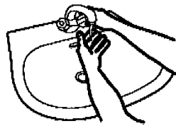
1. Hände mit Wasser benetzen

Händewaschen spielt eine entscheidende Rolle bei der Hygiene. Waschen Sie mehrmals täglich gründlich die Hände mit Wasser und Seife.